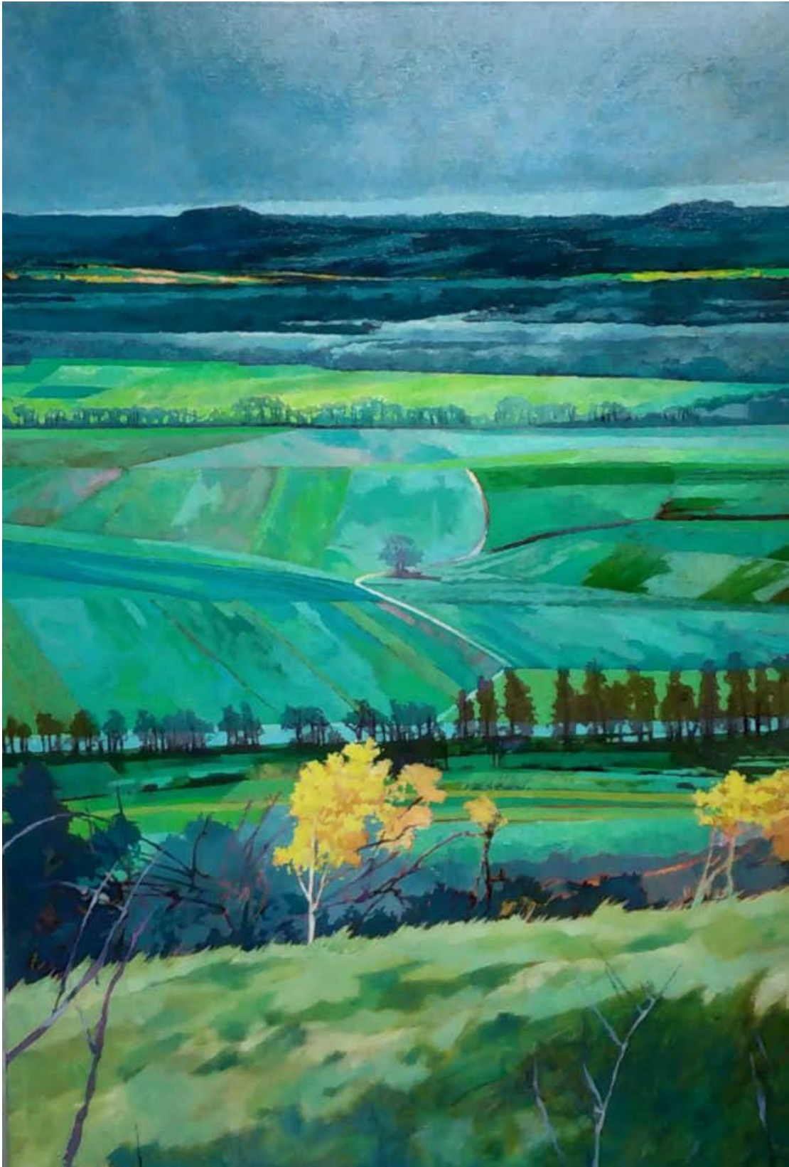
L'enfance , Christophe Wehrung